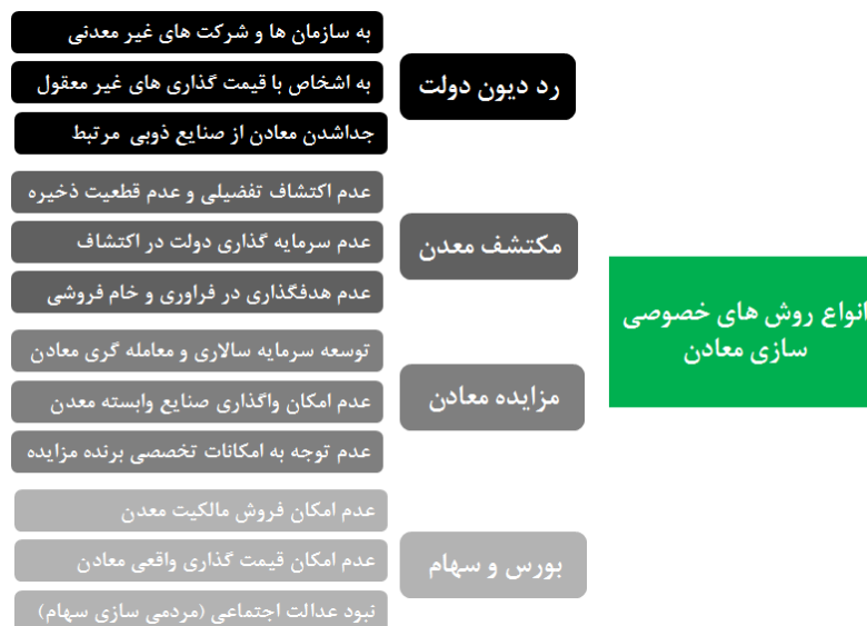
شکل ۱: روش های مختلف خصوصی سازی معادن و مشکلات آنها

خصوصی سازی یکی از مهمترین چالش معادن کشور طی چند دهه گذشته بوده است که به صورت مختلف اتفاق افتاده و هر یک به نوعی مشکلات مربوط به خود را داراست (شکل ۱).